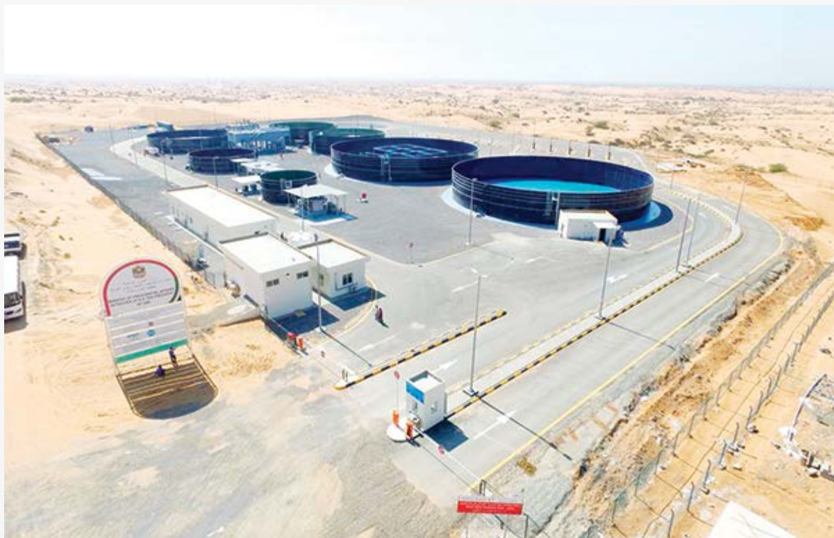
محطة الصرف الصحي (وام)